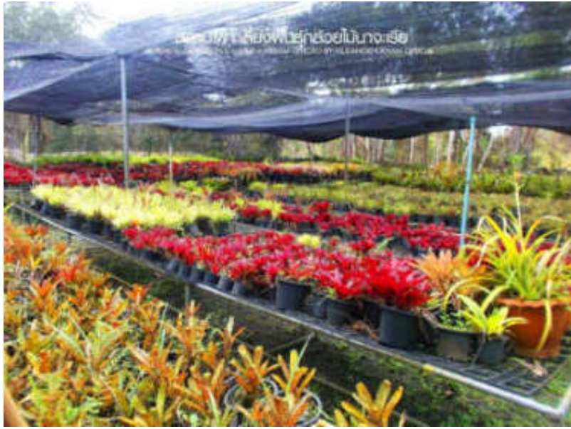
สถานีเพาะเลี้ยงพันธุ์กล้วยไม้นางจะเรีย ตั้งอยู่ที่หมู่บ้านทับทิมสยาม ๐๖ หรือชื่อเดิมคือบ้านนางจะเรีย ต.ปรีอใหญ่ อ.ชูขันธุ์ จ.ศรีสะเกษ