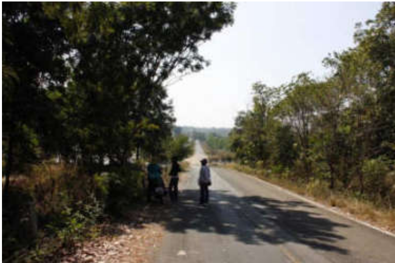
ภาพสันอ่างเก็บน้ำ และเป็นถนน ด้านหน้าคือฝายน้ำล้น

อ่างเก็บน้ำทับทิมสยาม ๑๖ แห่งนี้ นอกจากจะเป็นแหล่งน้ำสำคัญของชาวบ้านแล้ว ยังเป็นแหล่งอนุรักษ์พันธุ์ปลาตามธรรมชาติ ซึ่งกรมทรัพยากรธรรมชาติได้อนุญาตให้ผู้ปลูกมาปล่อยภายในอ่าง และผู้ม่อนุญาตให้ชาวบ้านเข้าจับปลาในพื้นที่นี้