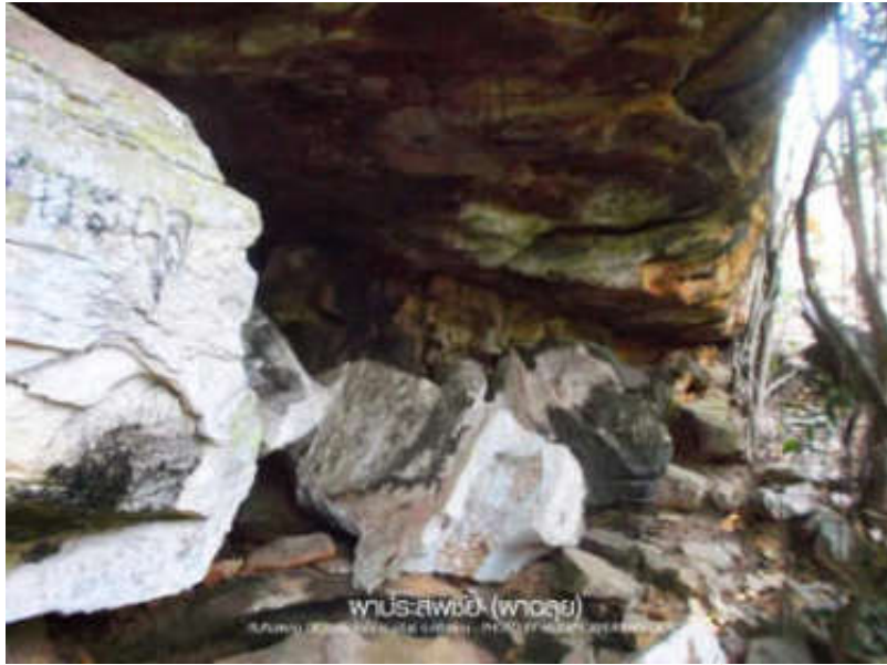
ด้านล่างเนินหน้าผา มีลักษณะเป็นโพรงคล้ายถ้ำ

นอกจากนี้ ตลอดระยะทางที่มุ่งหน้าสู่ผาประสพชัย ถนนเป็นแบบทางเข้าเลาะเลียบบ่า รถยนต์เข้าไปได้ระยะหนึ่ง หลังจากนั้นต้องใช้รถทหาร หรือรถขนาดเล็กเช่น รถจักรยานยนต์ เนื่องจากเส้นทางในป่านี้มีลักษณะสูงชัน และคับแคบ โดยตลอดระยะทางท่านจะได้พบกับพายุหินขนาดเล็ก - ใหญ่หลายจุด