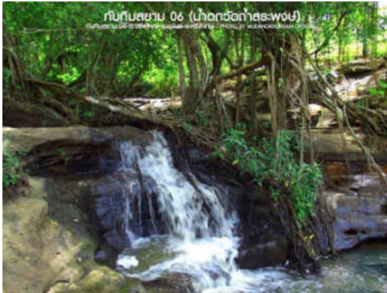
ลักษณะน้ำตกด้านบน มีลักษณะเป็นชั้นบันไดจำนวนมาก

นอกจากน้ำตกแห่งนี้จะมีความงดงามในช่วงฤดูฝนแล้ว บริเวณโดยรอบน้ำตกยังมีต้นไม้ขนาดใหญ่ขึ้นตามธรรมชาติ ทำให้บริเวณน้ำตกมีลักษณะอากาศที่เย็นร่มรื่นตลอดทั้งปี นักปฏิบัติธรรมหลายท่าน นิยมนั่งภาวนาริมธารน้ำตกแห่งนี้